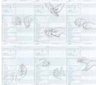
Handlungsanweisungen, 2003/2004, Tusche auf Papier, zeiteilig.